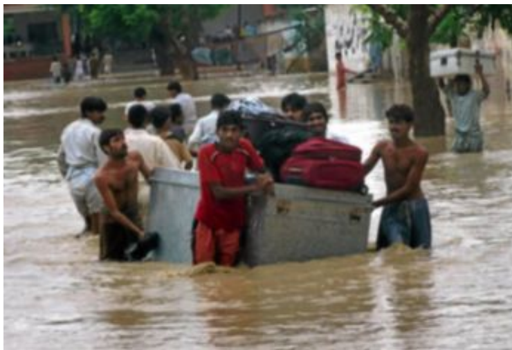
Katastroferna tornar upp sig: Invånare räddar sina tillhörigheter vid översvämningar i Pakistan.

Så får vi för varje år som går se katastrofen torna upp sig i realtid: stigande temperaturer, smältande is, allt fler och hårdare stormar.